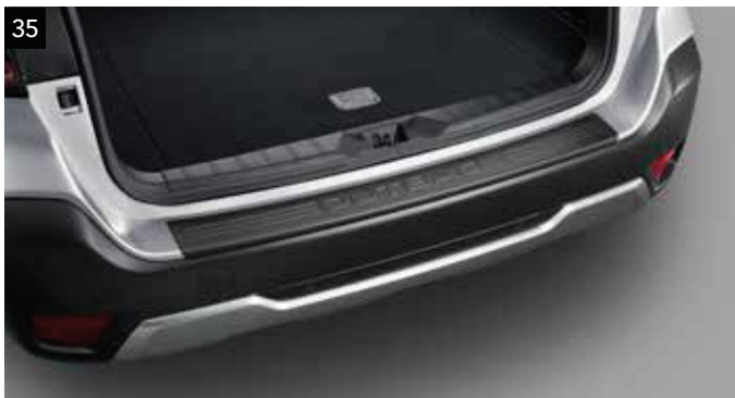
35 Ochrana nakladacej hrany batožinového priestoru (čierna)