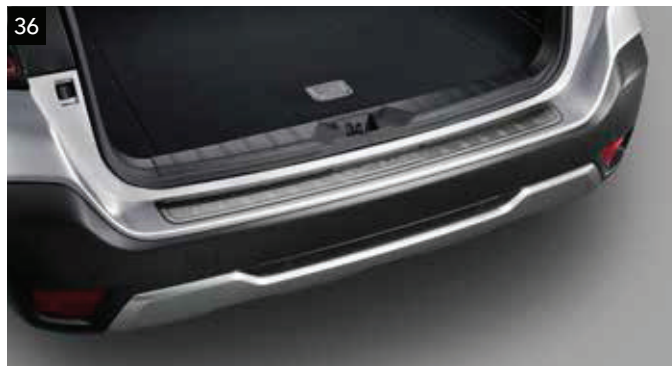
36 Ochrana nakladacej hrany batožinového priestoru (nehrdzavejúca oceľ)

Odolný plastový živicový kryt pomáha chrániť hornú hranu nárazníka.