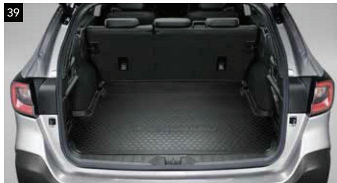
39 Plytká vaňa do batožinového priestoru

Poskytuje zvýšenú ochranu podlahy a stien nákladného priestoru pred prachom, nečistotami a tekutinami.