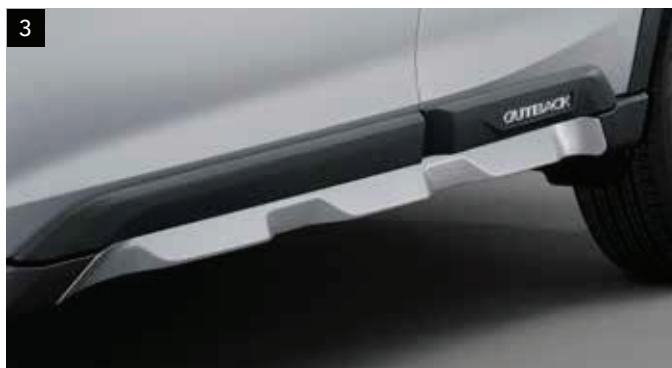
3 Ochranná lišta prahov (živicová)

Zvýrazňuje dizajnové prvky a chráni bok karosérie.