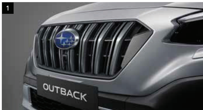
1 Predná maska