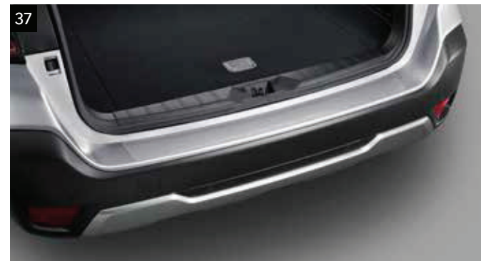
37 Ochranná fólia nakladacej hrany batožinového priestoru (priehľadná)

Kryt z nehrdzavejúcej ocele chráni zadný nárazník pred poškrabáním.