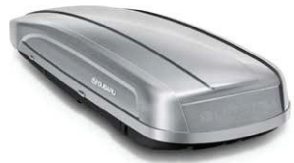
20 Športový strešný box (strieborný)