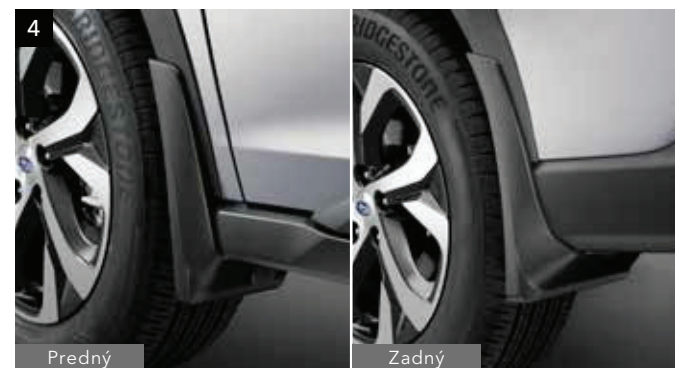
4 Súprava lapačov nečistôt

Zvýrazňuje dizajn bokov vozidla a podčiarkuje jeho terénny vzhľad.