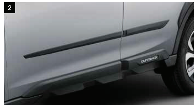
2 Bočná ochranná lišta

Dizajn mriežkovanej sieťoviny zo živice dodáva prednej časti úplne nový vzhľad. *Ak vozidlo nie je vybavené prednou kamerou, je potrebný kryt kamery.