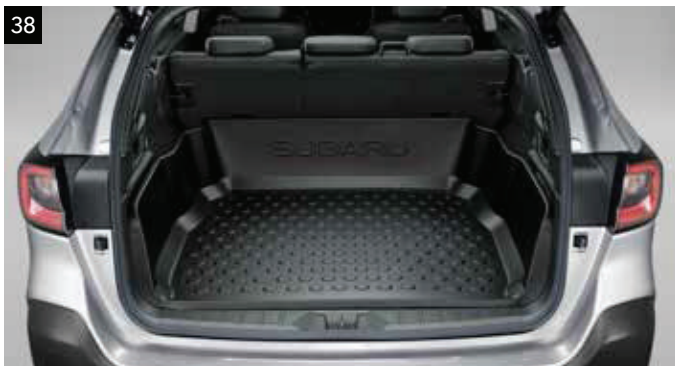
38 Hlboká vaňa do batožinového priestoru

Priehľadná fólia, ktorá chráni vrchnú hranu nárazníka pred poškrabáním.