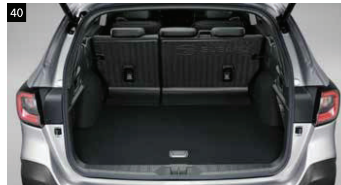
40 Zvýšená ochrana zadných sedadiel

Chráni podlahu nákladného priestoru pred prachom a nečistotami.