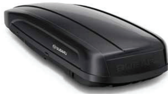
19 Športový strešný box (čierny)